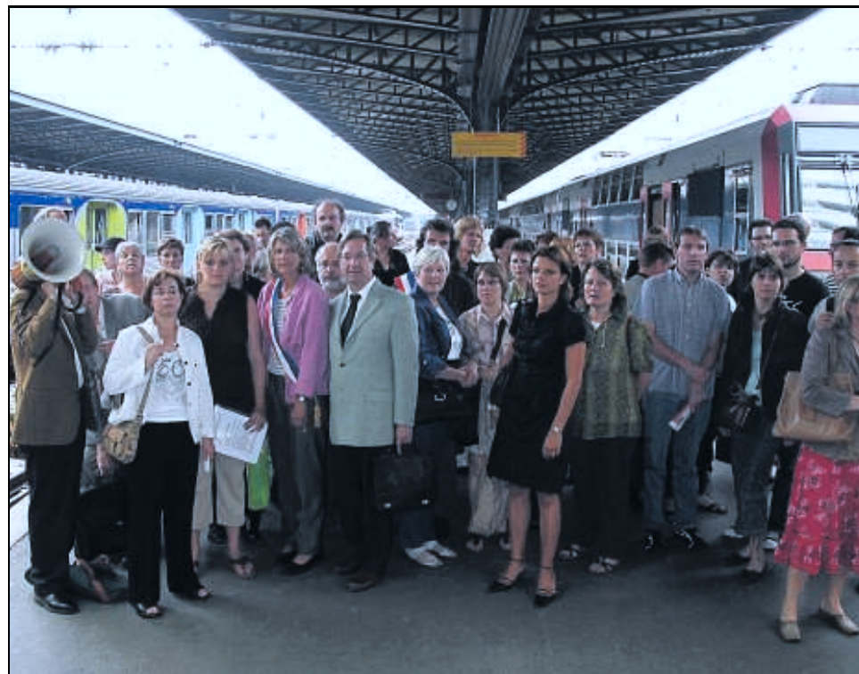
PARIS, GARE DE L'EST, HIER A 17 H 30. Rejoins par quelques élus locaux, les usagers de trois associations des lignes Paris-Meaux et Paris-Provins manifestaient hier soir à la gare de l'Est contre les changements d'horaires liés à l'arrivée du TGV Est.